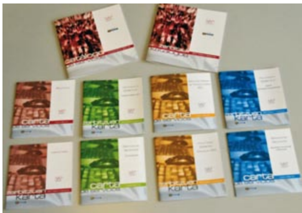
Catálogo de Servicios, y 4 Cartas de Servicios.

En cuanto a la web, las visitas durante el año 2010 fueron 2.083.422 con 10.995.670 páginas vistas, lo que supone una media de 5,28 páginas por visita. El aumento de más de un millón de visitas respecto al año 2009, está motivado por la convocatoria de la Oferta de Empleo Público, que se ha desarrollado en su totalidad a través de Internet, desde la realización y pago de la solicitud, hasta el seguimiento del proceso selectivo. Las solicitudes recibidas fueron 36.654.