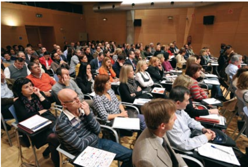
Asistentes a una jornada organizada por el IVAP.