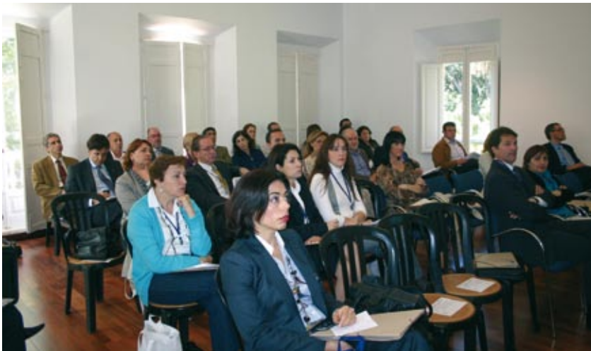
VI Jornadas de Modernización y Calidad, Málaga, abril 2010.