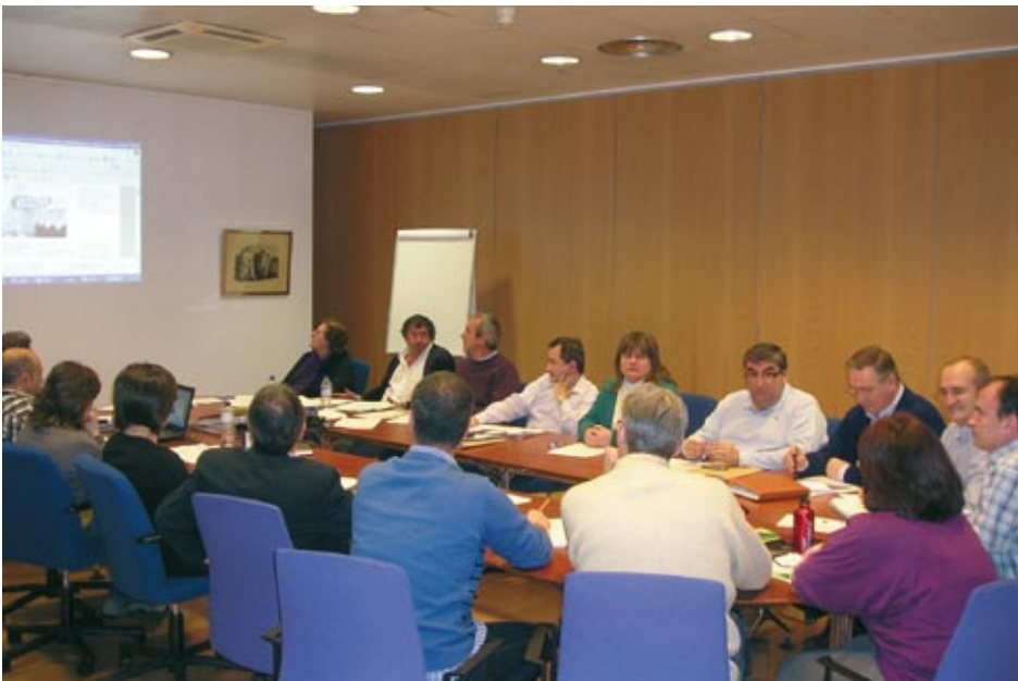
Equipo de coordinación del IVAP.

San Bartolomé 28 20007 Donostia-San Sebastián