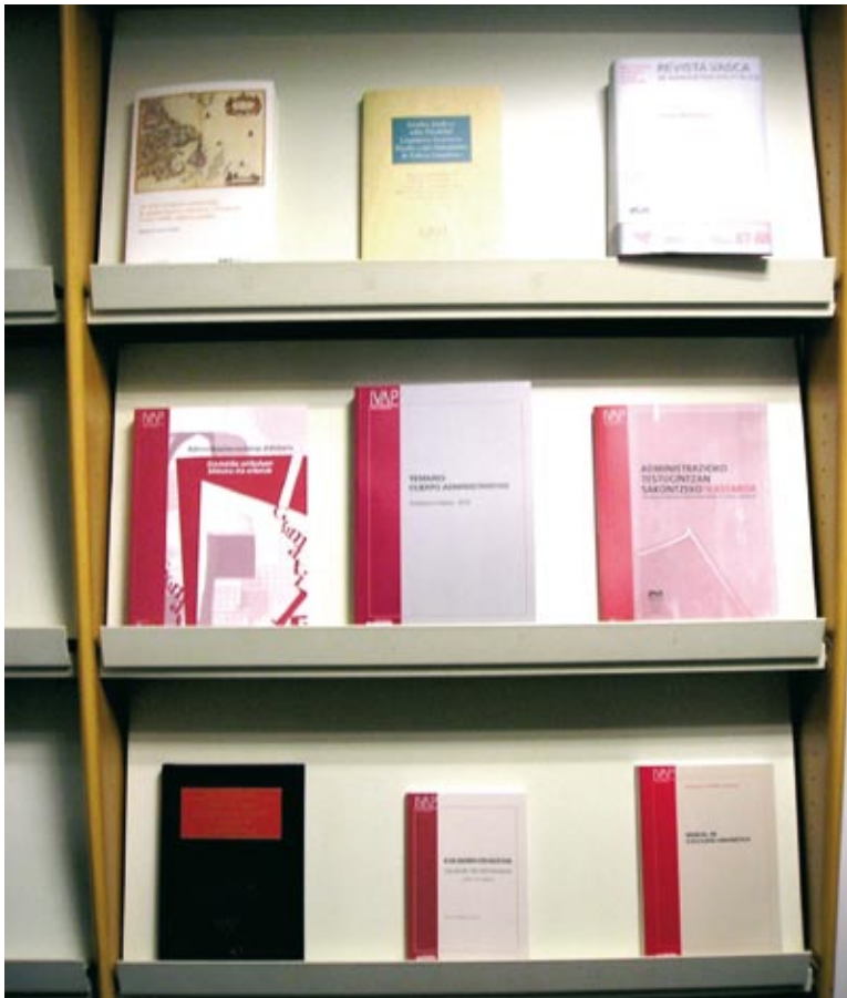
Algunas de las publicaciones de 2010

Herri-Arduralaritzazko Euskal Aldizkaria = Revista Vasca de Administración Pública. Oñati (Gipuzkoa): Instituto Vasco de Administración Pública = Herri Arduralaritzaren Euskal Erakundea,-1981. Cuatrimestral. ISSN 0211-9560. 2010, n. 86, 87 y 88