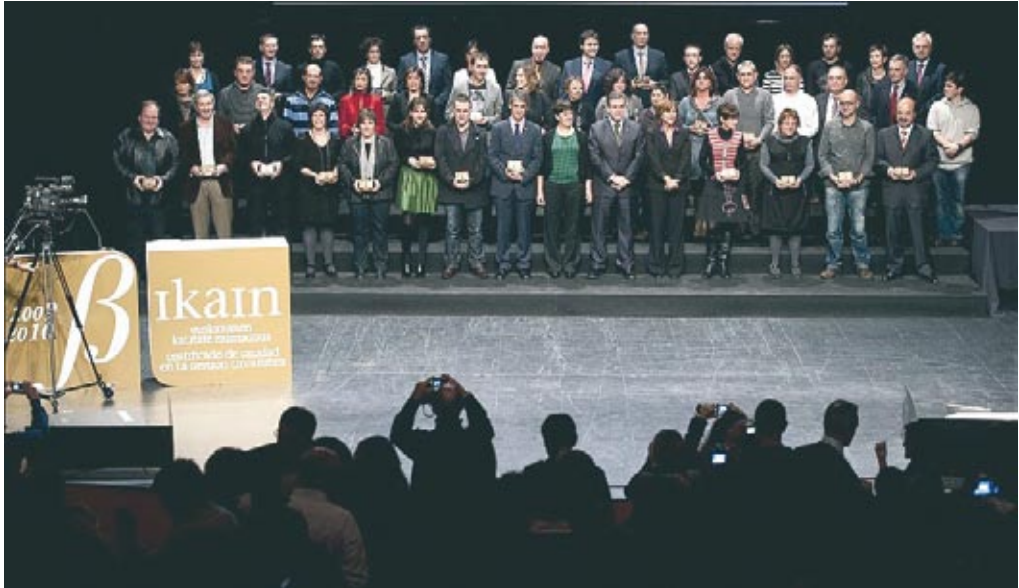
Acto de entrega de Bikain.