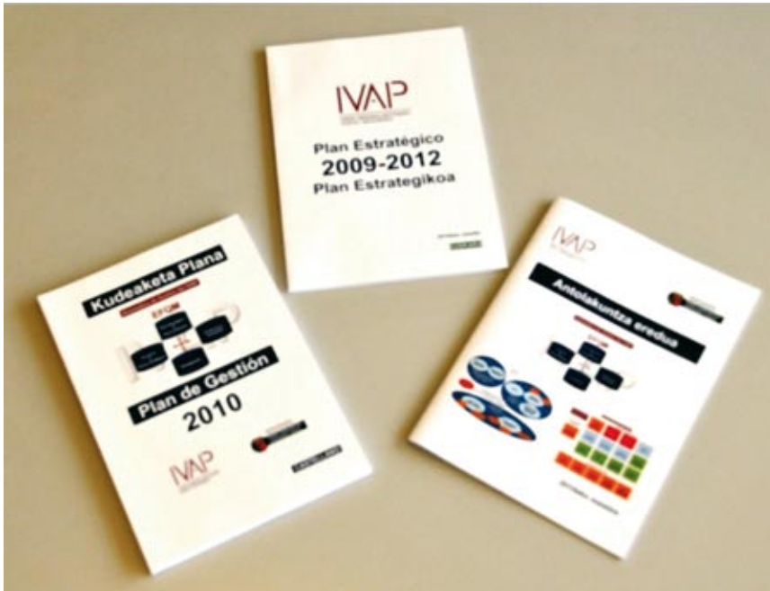
Plan Estratégico 2009-2012, Plan de Gestión 2010 y Modelo Organizacional del IVAP.