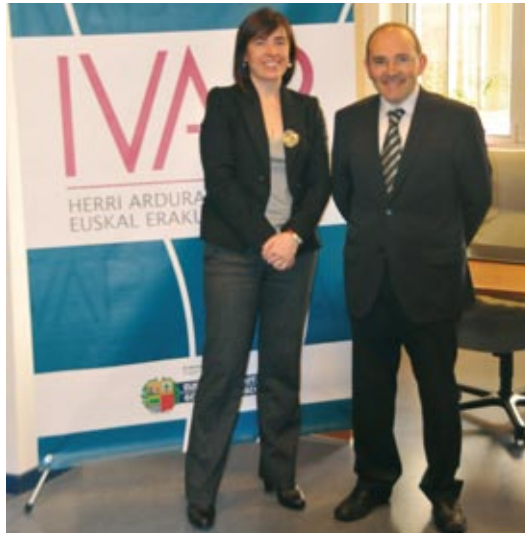
Alianza Estratégica con la Dirección de Innovación y Administración Electrónica del Gobierno Vasco.