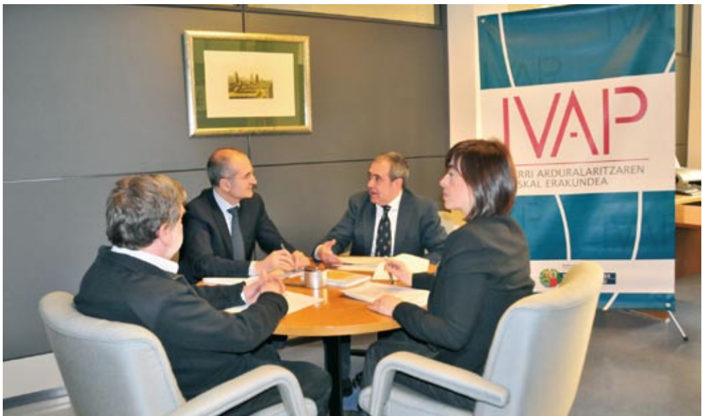
Equipo directivo del IVAP.

Decíamos entonces que lo que pretendíamos es que la Memoria fuera un instrumento para darnos mejor a conocer, para divulgar nuestra cartera de servicios y llegar mejor a las Administraciones públicas vascas.